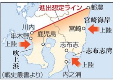
オリンピック作戦での 米軍の侵攻計画

今や連日TV中継や、臨時テロップ、新聞号外 と大騒ぎは作戦なのです。始めてしまえばこの国 は沸き立ち、理念や開催の可否を問うなど吹き飛 んでしまうと、筋書きに書かれているようです。 好成績Ⅱ「日本国のために」との盛り上がり 期待する人達は、衆議院選挙あわよくば憲法改変 の機運として目論んでいるのかもしれない。 昭和史の中で、本土決戦を、米軍側から言う